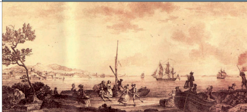
© Gravure 19 e anonyme DR

Créée en 1988, SITE regroupe des photographes qui se proposent de « promouvoir, de favoriser et d'animer la recherche sur l'image des lieux et des territoires ». Le projet collectif est un contrat définissant un axe de travail autour duquel se greffent les projets individuels. L'axe de travail de SITE est le territoire. SITE définit le territoire comme un espace structuré symboliquement par un ensemble de pratiques d'appropriations visibles. Le projet de SITE est de travailler sur cette visibilité. Ce travail consiste à parcourir les lieux, à s'imprégner de l'espace et de ses formes. Ce travail s'effectue photographiquement. Ces dernières années, SITE a orienté ses recherches photographiques sur l'urbain, la mutation du paysage et sa transformation par le biais de financements publics, ou de commandes. Les travaux sont diffusés en exposition et en édition.